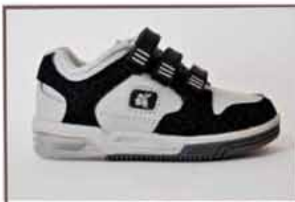
CÓDIGO BZ30 PÁG 19