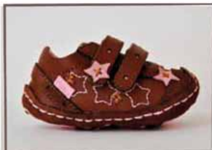
CÓDIGO BZ12 PÁG 5