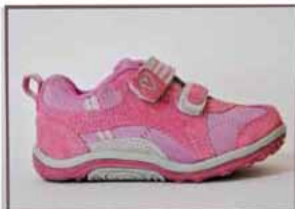
CÓDIGO BZ34 PÁG 11