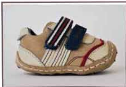
CÓDIGO BZ11 PÁG 13