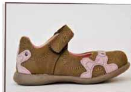
CÓDIGO BZ17 PÁG 6