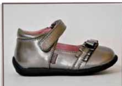
CÓDIGO BZ27 PÁG 8