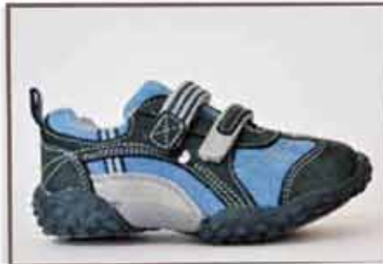
CÓDIGO BZ25 PÁG 17