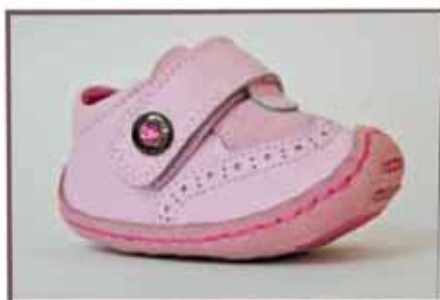
CÓDIGO BZ10 PÁG 4