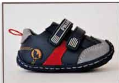
CÓDIGO BZ13 PÁG 14