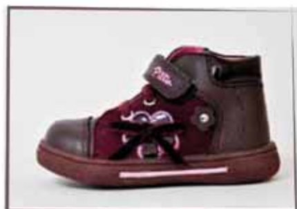
CÓDIGO BZ19 PÁG 7