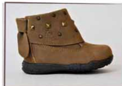
CÓDIGO BZ35 PÁG 12