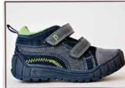
CÓDIGO BZ26 PÁG 18