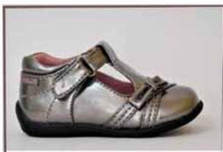
CÓDIGO BZ29 PÁG 10