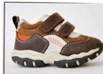
CÓDIGO BZ21 PÁG 15