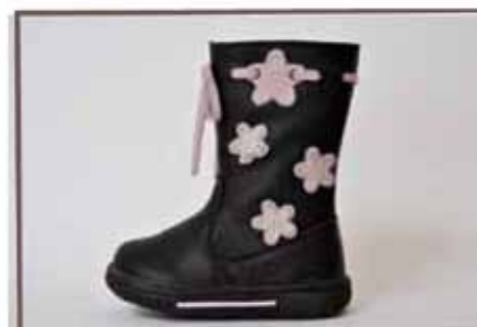
CÓDIGO BZ28 PÁG 9