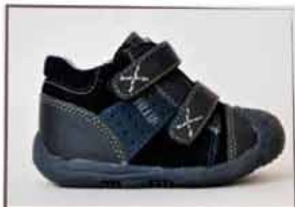
CÓDIGO BZ22 PÁG 16